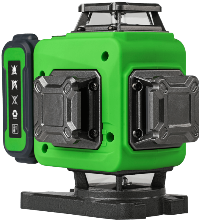
Лазерный уровень AMO LN 4D-360-2